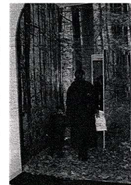
Bienvenue dans la Grande galerie de l'espace culturel Condorcet...

Ce type d'engagement traduit aussi une conception particulière de la politique culturelle menée à Viry-Chatillon : permettre à chacun, quel que soit son âge, son quartier, son niveau d'études... d'accéder à des œuvres actuelles, à l'art contemporain encore trop souvent perçu comme difficilement accessible.